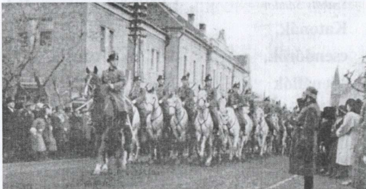
A kiskunhalasi lovastanosztály díszmenete