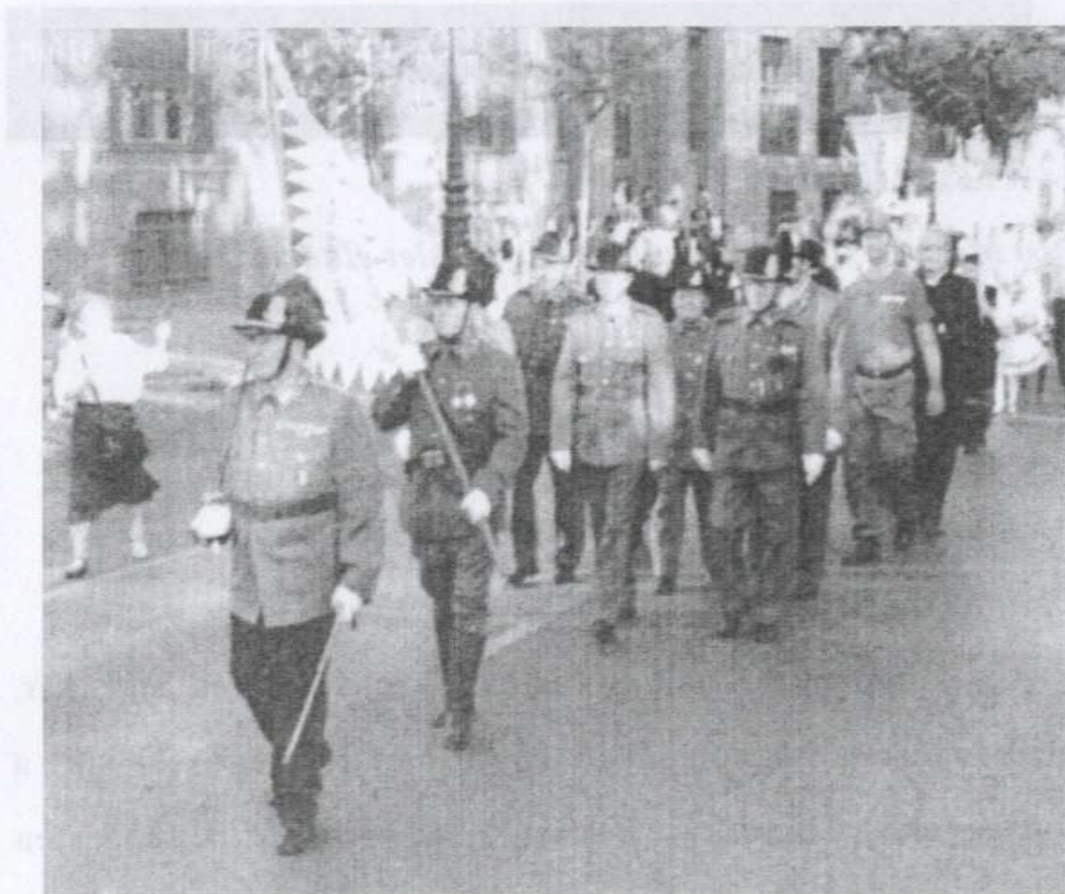
Az MCSBE 2017-es Szent Jobb Körmeneten

A budapesti ünnepségre az Esztergom-Budapesti Főegyházmegye meghívására érkeztünk az ország számos településéről és a Felvidékről. Szeretettel vártak és fogadtak minket tb. csendőröket. Mivel az ünnepség helyszínére nem egyidőben érkeztünk, a szervezők gondoskodtak elhelyezésünkről is a Nádor utcai Hild József Általános Iskolában.