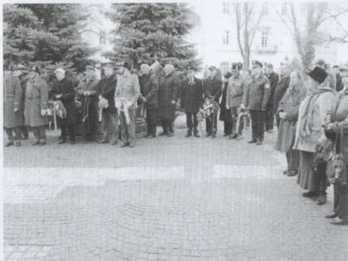
A Hadtörténet Intézet díszudvarán