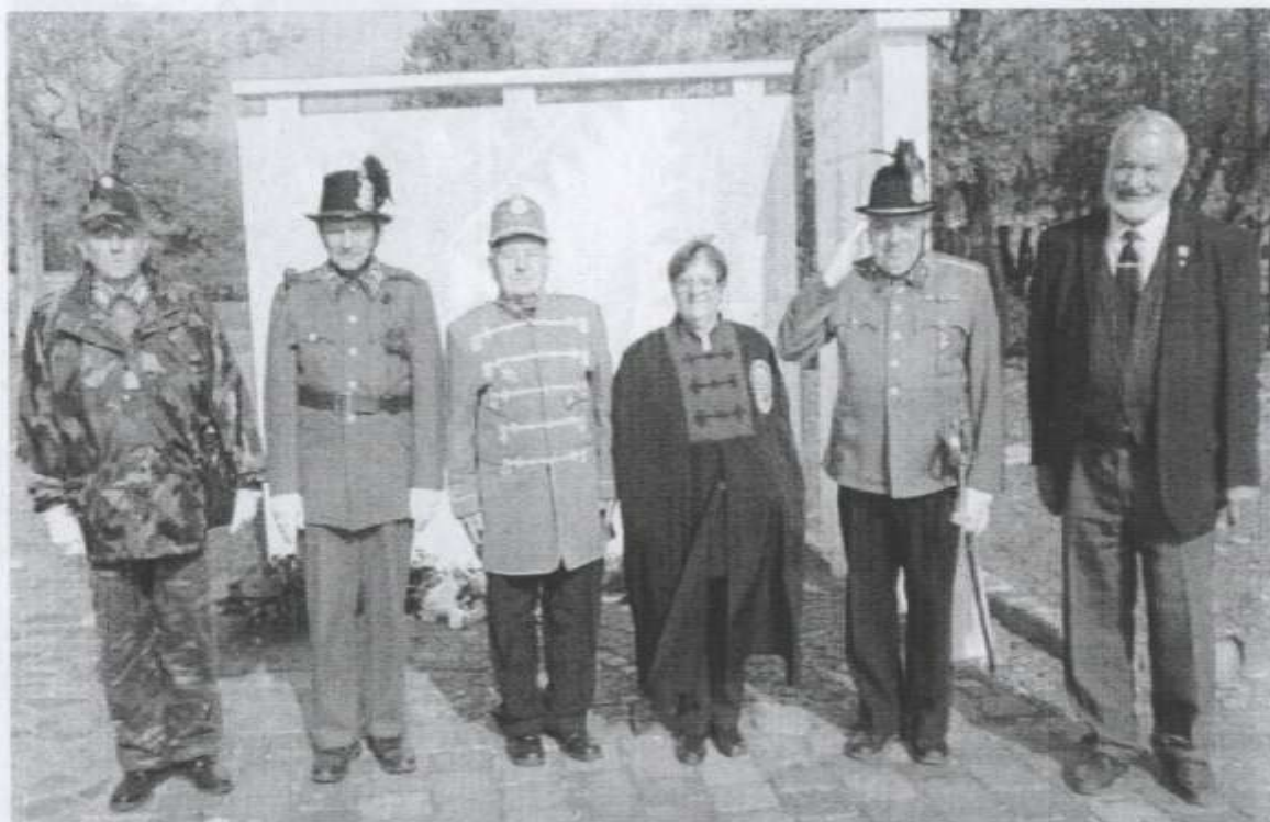
MCSBE küldöttsége az 1956-os hősök központi emlékhelyén 2017. október 20.