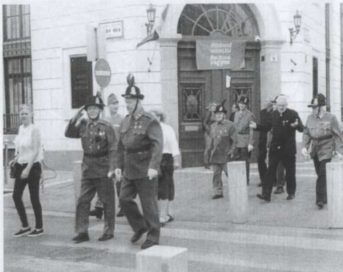
Csendőrök Budapest utcáin 2017-ben