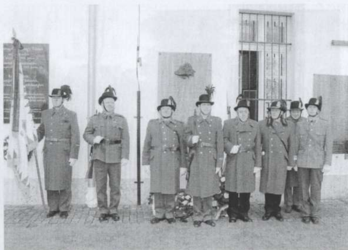
Az I-II. Világháború csendőrhőseinek emlékhelyén