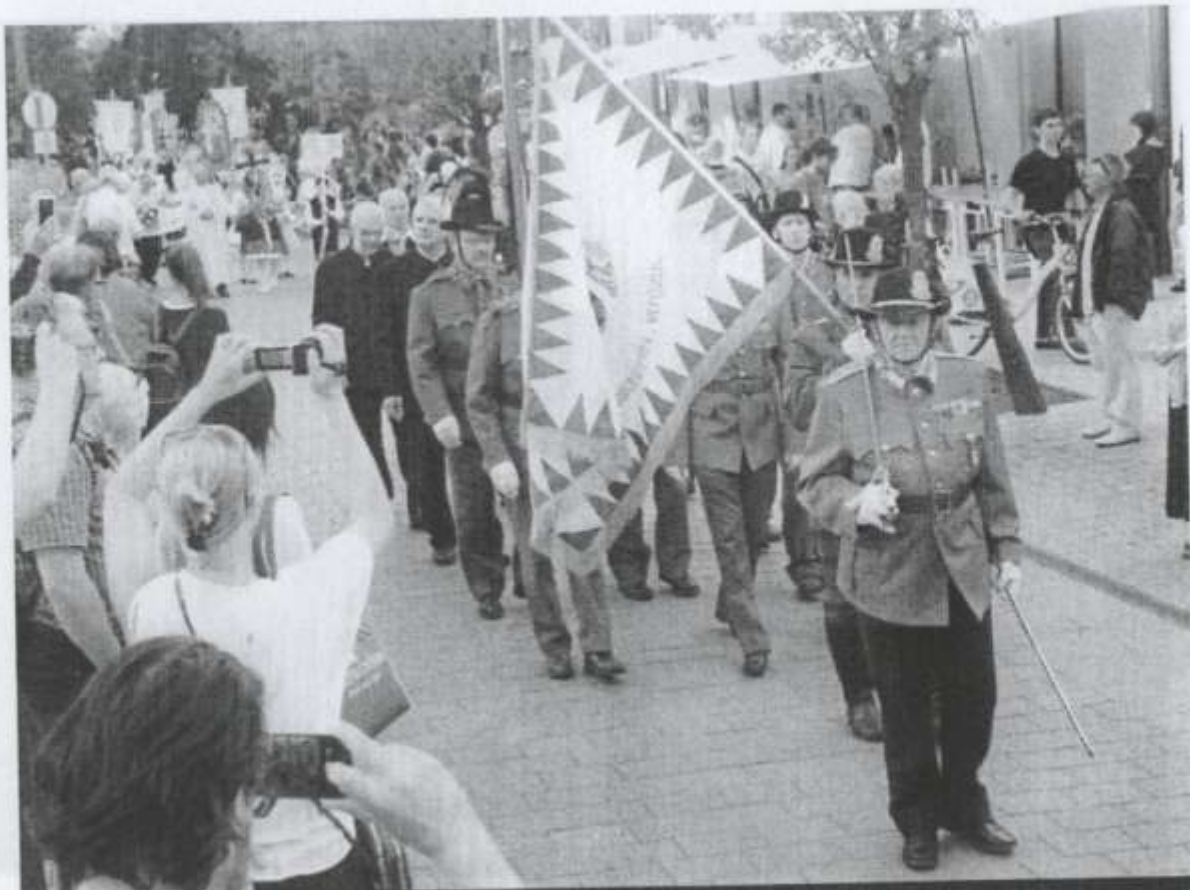
Ünneplők között Budapesten csendőr díszalegységben