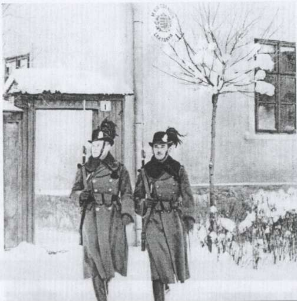
Indul a járőrszolgálat