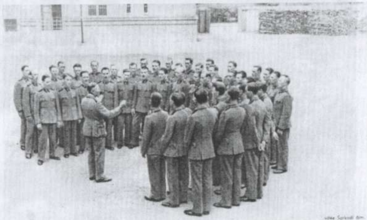
Az ungvári iskola énekkara